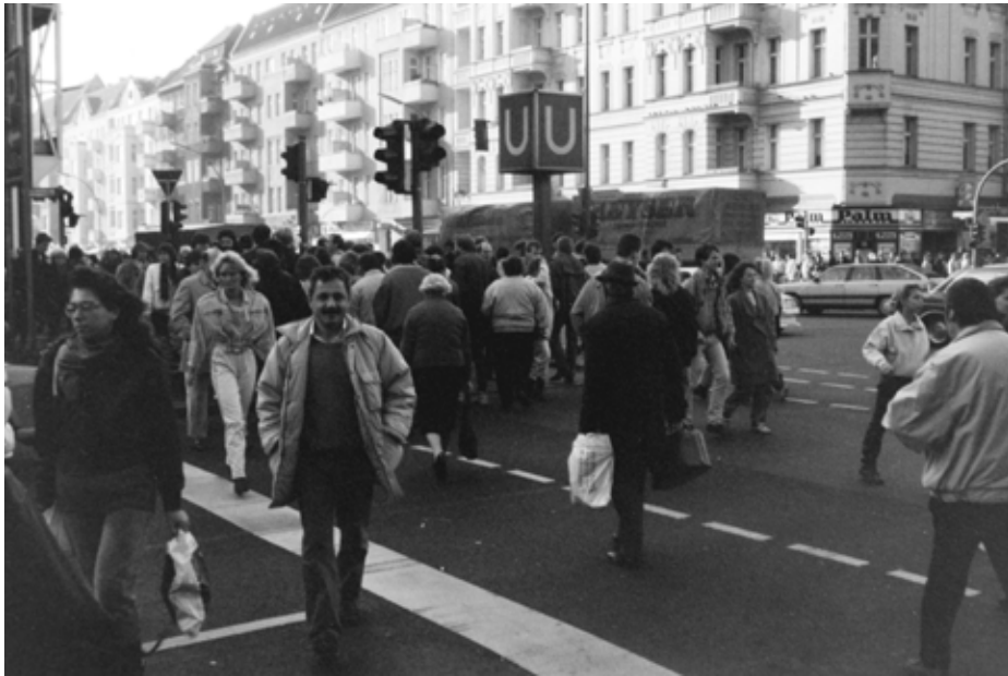
ALDI in der Müllerstraße erfreut sich außergewöhnlichen Zulaufs, all diese neuen Produkte und Kunden!