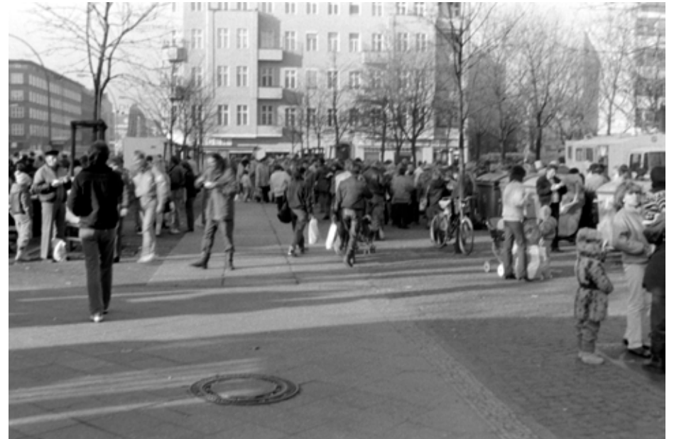
November 1989, auf dem Leopoldplatz sind zahlreiche DDR-Bürger eingetroffen, es gibt Suppe und lange Schlangen vor den Banken um die 100 D-Mark Begrüßungsgeld abzuholen.