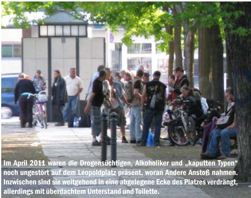
Im April 2011 waren die Drogensüchtigen, Alkoholiker und „kaputten Typen“ noch ungestört auf dem Leopoldplatz präsent, woran Andere Anstoß nahmen. Inzwischen sind sie weitgehend in eine abgelegene Ecke des Platzes verdrängt, allerdings mit überdachtem Unterstand und Toilette.